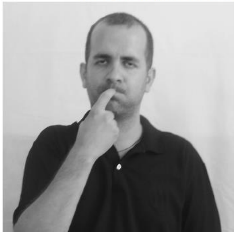
PERTO muito (dedo na boca)